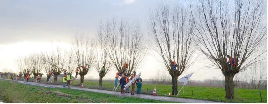
Knotten gemeentelijke wilgen aan de Hamseweg.