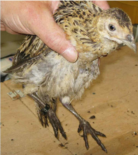
Fazantkuiken met pootring

Mijn collega Leo en ik gaan naar het opgegeven adres. Het aantal gehouden fazanten bleek fors overschat. De man had slechts zo'n dertig fazanten. Dertien jonge fazanten liepen apart. Die jonge fazanten hadden pootringen. Dat is ook wettelijk voorgeschreven, want de fazant ( Phasianus colchicus ) is volgens de Flora- en faunawet een beschermde diersoort.