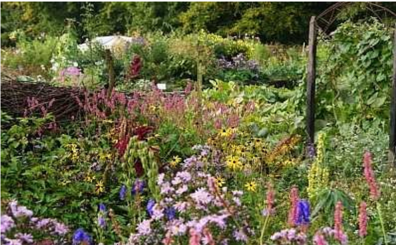
Natuurbelevingstuin Landgoed Nieuwkerk

Van 20.00 – 22.00 uur in Parkgebouw de Liniehof.