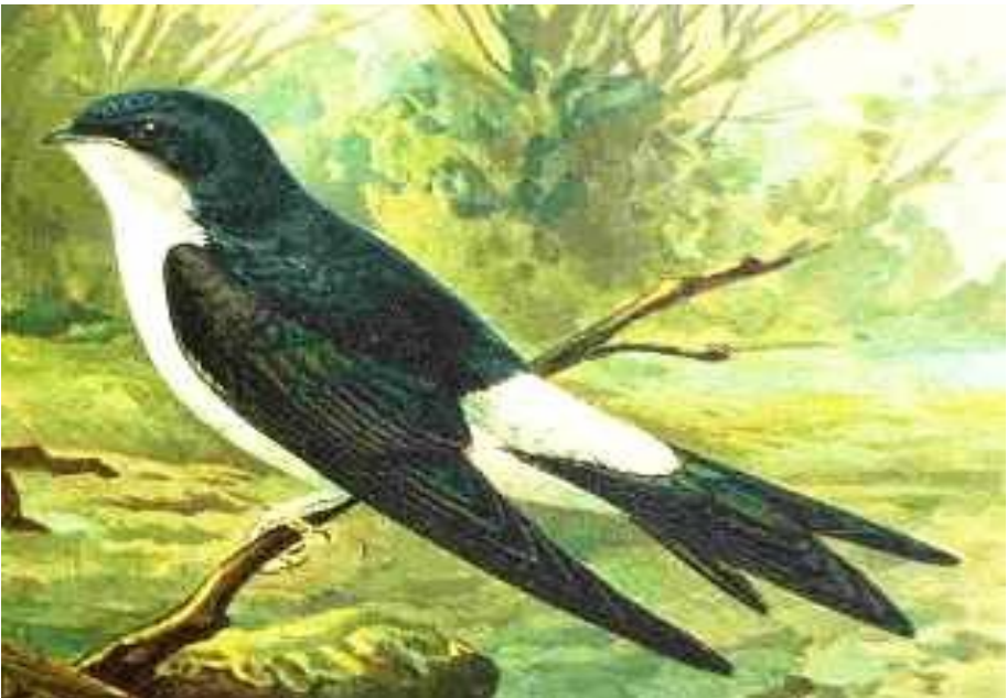
Huiszwaluw (Delichon urbicum)

In Made en Drimmelen hangen veel kunstnesten voor huiszwaluwen. Als er huiszwaluwen in een straal van 100 meter broeden is er grote kans dat deze binnen enkele jaren worden bewoond. Misschien een leuk idee om de huiszwaluw meer kans te geven.