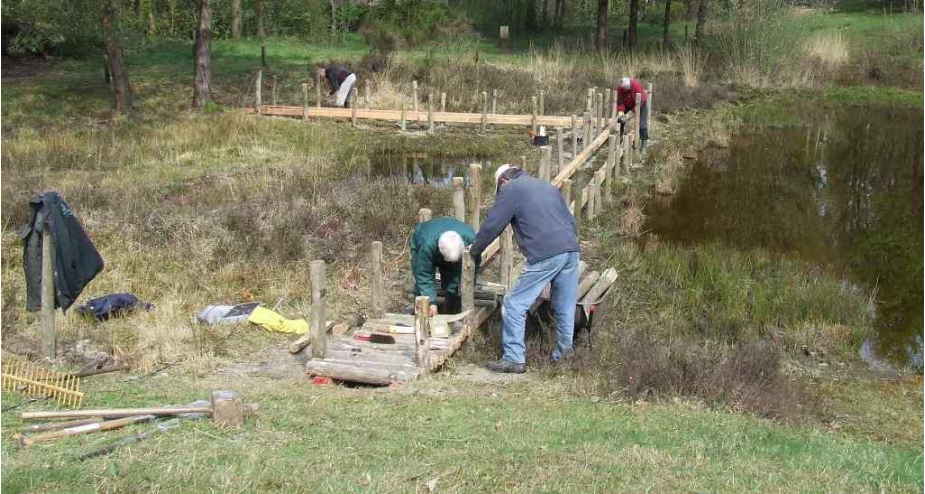
Aanleg van de knuppelbrug over de moerassige noordoever van de duinvijver. Foto: Ankie Stoop, 11 april 2012

Na het wateronderzoeksplatform in de centrale vijver van het natuurpark is nu ook de duinvijver voorzien van een prachtig nieuw natuuravontuur voor het van dichtbij bekijken van waterbeestjes!